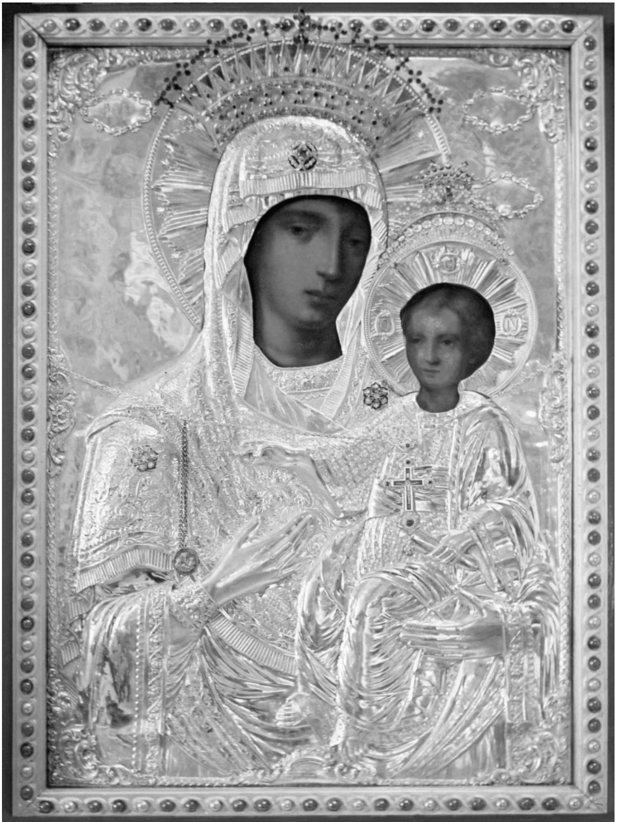
Maica Domnului “PRODROMIȚA” Sf. Munte Athos