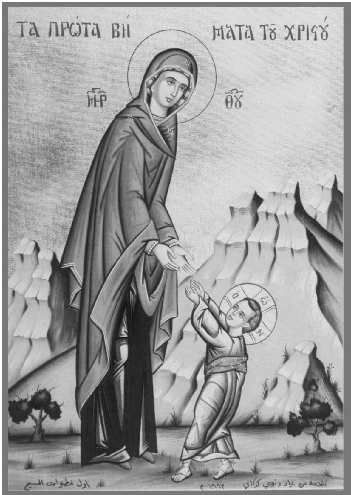
Maica Domnului cu Pruncul Iisus